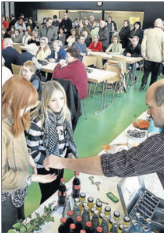
An der Hauptschule in Lengede wurde 2008 die neue Schulmensa eröffnet.