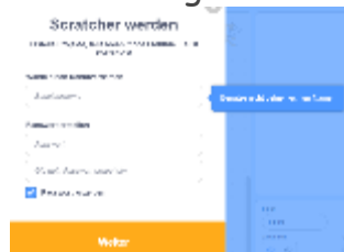
Benutzungsoberfläche, wenn man ein Konto erstellt hat:

Scratch ist eine grafische Programmiersprache und richtet sich an Kinder und Jugendliche. Die Programmiersprache erlaubt es auf sehr einfache Weise, interaktive Geschichten, Animationen, Spiele, Musik und Kunstwerke zu erstellen und sie anderen als Scratch-Projekte über das Internet mitzuteilen. Die grafische Programmierung erlaubt schnelle Lernerfolge und das Programmieren ohne Kenntnis einer Programmiersprache.